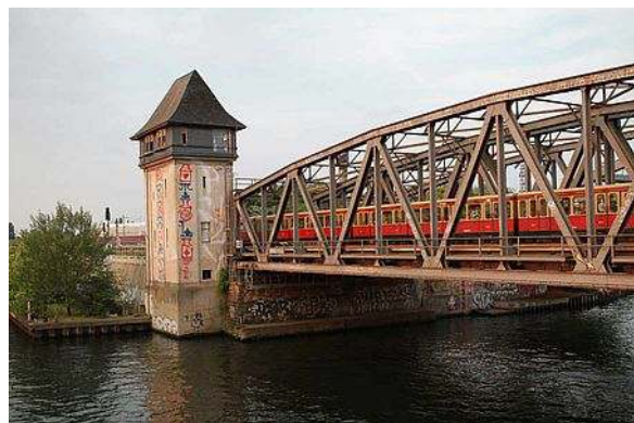
Stellwerk und S-Bahn